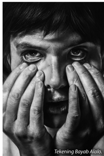
Tekening Bayab Alalo.

Je vindt de hyperrealistische kunst van Bayan Alalo op Instagram: @BAYANN963 .