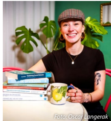
Door Emma Matthee

Studenten ervaren stress door studie en financiële zorgen. Toch blijkt uit een onderzoek van het Nibud dat ze er over het algemeen financieel redelijk goed voor staan. De herinvoering van de basisbeurs heeft bijgedragen aan een verbeterde financiële situatie voor hbo- en wo-studenten. Die zeggen beter te kunnen rondkomen.